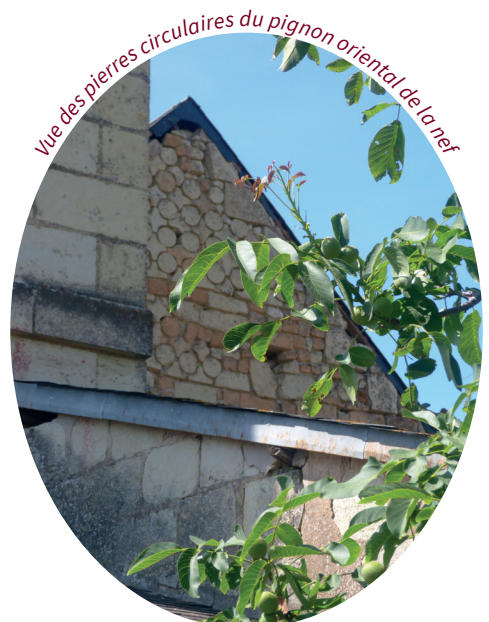
Vue des pierres circulaires du pignon oriental de la nef

partie supérieure du portail est reprise, des contreforts sont ajoutés sur la façade nord de la nef et sur le chevet, pour palier aux désordres structurels de l'édifice et aux mouvements de terrain. Enfin, le clocher-tour est ajouté à la fin du 19 e siècle.