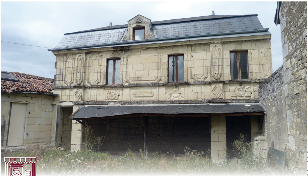
Relais de la Poste