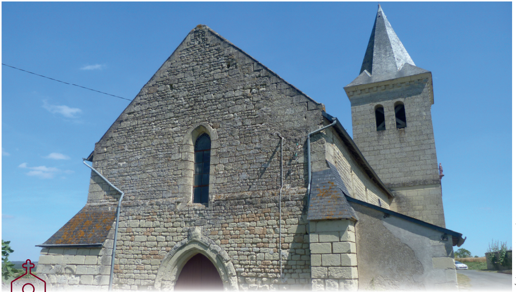
Eglise Saint-Pierre de Tourtenoy