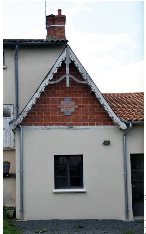
Ancien bureau de tabac

À la fin du 19 e siècle et jusqu'au 1 er quart du 20 e siècle, la commune s'enrichit par l'exploitation des carrières et se dote d'institutions publiques et de commerces toujours présents dans le bourg. Le Relais de la poste, reconnaissable par sa galerie extérieure servant de point d'arrêt pour les cavaliers, est de style néoclassique et porte la date de 1887 sur le fronton de sa lucarne. En face, l'ancienne forge troglodytique est agrandie par l'ajout d'une maison d'habitation à la fin du 19 e siècle. Le passage encaissé est conservé vers la forge. Au carrefour de la rue principale et de la rue de l'école, le tabac avec son pignon en brique, est couvert d'un toit à longs pans dont les débords sont décorés par un lambrequin* en bois. De l'autre côté de la cour, l'atelier du charron* conserve sa porte charretière* , et ses trous de boulin indiquant la présence d'un pigeonnier. Enfin la société « l'Union » créée au début du 20 e siècle existe toujours. Elle est le dernier témoin de l'âge d'or des commerces de Tourtenay.