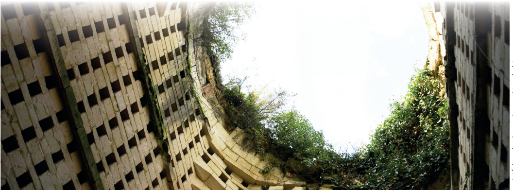
Intérieur du pigeonnier semi-troglodyte

Le second pigeonnier associé à une ferme du 17 e siècle semble dater de la même époque. Cette tour semi-troglodyte est de forme circulaire. Autrefois accessible par un escalier en pierre, il se compose d'une pièce carrée percée d'environ 1200 trous de boulin. La coupole en pierre sèche qui couvrait le pigeonnier n'existe plus. Une ouverture rectangulaire en soubassement permettait l'écoulement des fientes de pigeons vers une pièce en rez-de-chaussée. Les fientes étaient notamment utilisées comme engrais dans les champs et les vignes.